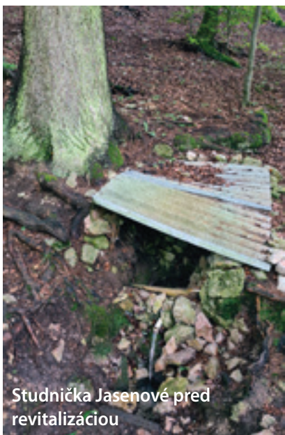
Studnička Jasenové pred revitalizáciou

O tom, že Rajecká dolina je dolinou vody, niet pochýb. Dolinou sa vinie malebná rieka Rajčanka a skvelé meno regiónu robí aj pramenitá voda Rajec. Termálna liečivá voda v Rajeckých Tepliciach už pomohla nejednému návštevníkovi tohto kúpeľného mestečka. Liečivé účinky sa pripisujú aj prameňu, ktorý vyviera pod Lurdskou kaplnkou na pútnickom mieste v Rajeckej Lesnej.