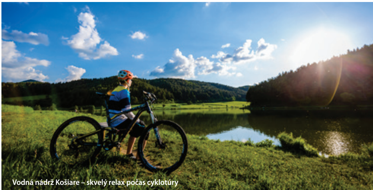
Vodná nádrž Košiare – skvelý relax počas cyklotúry