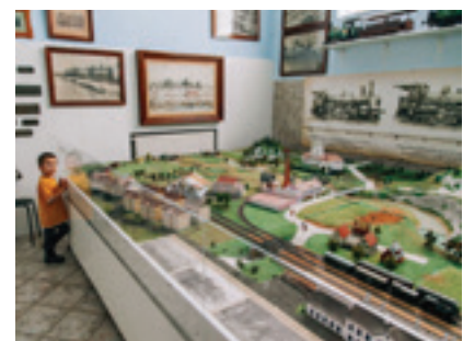
Múzeum dopravy - Rajecké Teplice

Viete, že si tu môžete pozrieť motocykle značky Ariel, najstaršie československé motocykle Jawa a prvý typ motocykla z Považských strojární Manet 90?