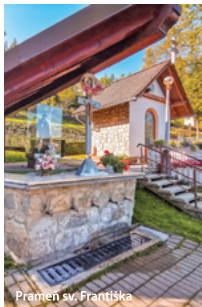
Prameň sv. Františka

Prameň svätého Františka vyteká spod Frivaldskej kalvárie v známej slovenskej obci Rajecká Lesná. Kalváriu postavili veriaci v rokoch 1920 - 1921. Tvoria ju 14 kaplniek a Kostol