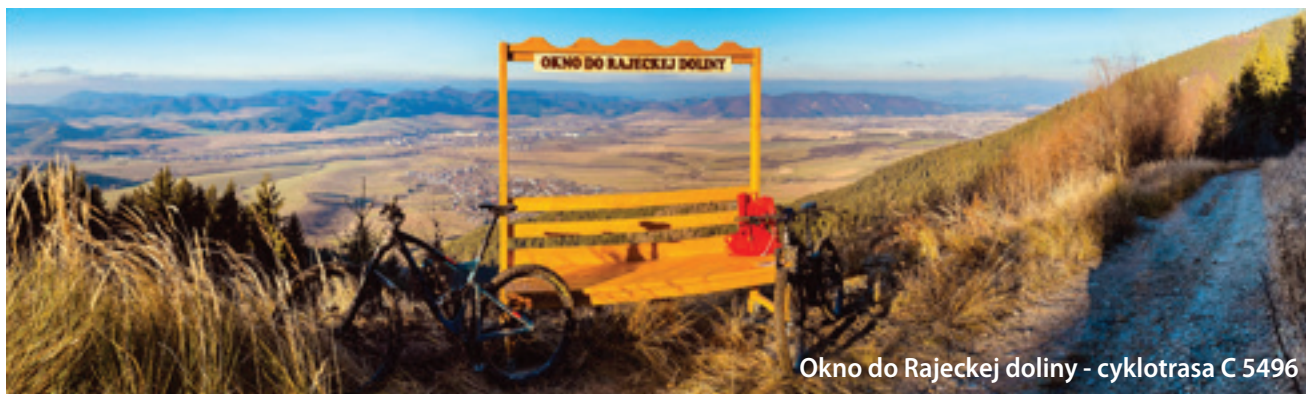
Okno do Rajeckej doliny - cyklotrasa C 5496