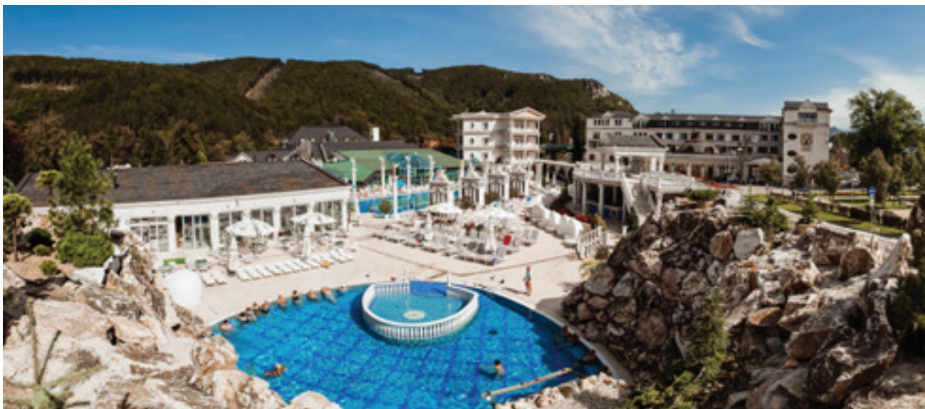
Kúpele SPA Aphrodite - Rajecké Teplice

Viete, že kúpele v roku 2019 otvorili SPA REHAB CLINIC? Je to špičково vybavené rehabilitačné centrum, v ktorom sa zdravotnícky tím venuje prevencii a liečbe bolestivých stavov pohybového aparátu.