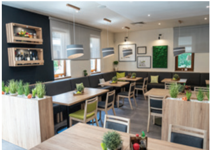
MERITTO reštaurácia & apartmány