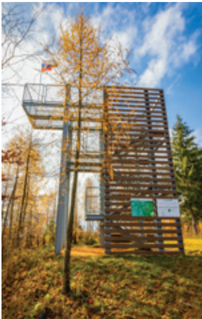
Náučný chodník Okolím Rajeckého hradu a rozhľadňa Rajec

Viete, že prvá písomná zmienka o Rajeckom hrade pochádza z roku 1299, no postavený bol niekedy v poslednej štvrtine 13. storočia? Existujú správy, že pôvodným majiteľom hrad násilne zabral v roku 1297 Matúš Čák Trenčiansky. Po jeho smrti hrad pripadol kráľovi. V rokoch 1392