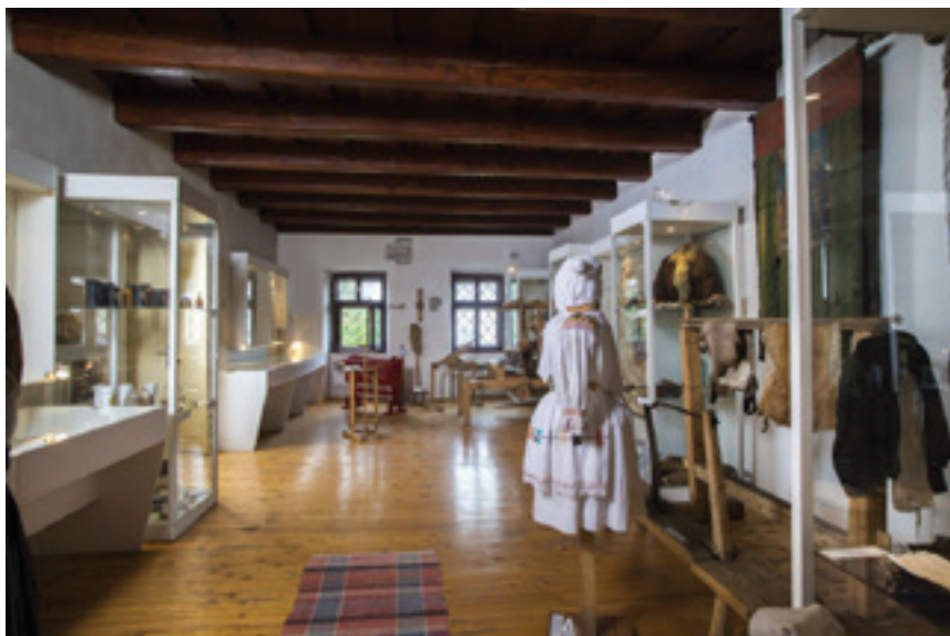
Mestské múzeum v Rajci

Nový náučný chodník „Okolím Rajeckého hradu“ rozšíril turistickú infraštruktúru v druhej polovici roku 2017. Informačné tabule sú umiestnené postupne od budovy Mestského múzea v Rajci, pri vstupe na termálne kúpalisko Veronika a ďalej naprieč horským masívom Dubová. Informačné tabule oboznamujú návštevníka s miestnou flórou, faunou, s históriou mesta Rajec a Rajeckej doliny. Na vyhlídkovo atraktívnych miestach sú pre turistov inštalované oddychové zóny s lavičkami, stolmi a odpadkovými košmi. Na zastávke č. 7 si môžu turisti vychutnať pohľad na Rajeckú dolinu z novovybudovanej rozhľadne.