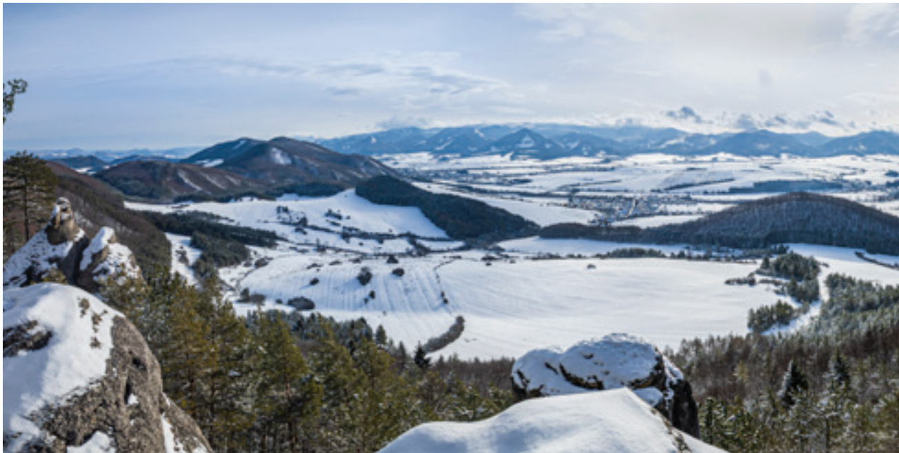
Výhľad zo skalného útvaru Babice nad Zbyňovom patrí k najkrajším pohľadom na Rajeckú dolinu.