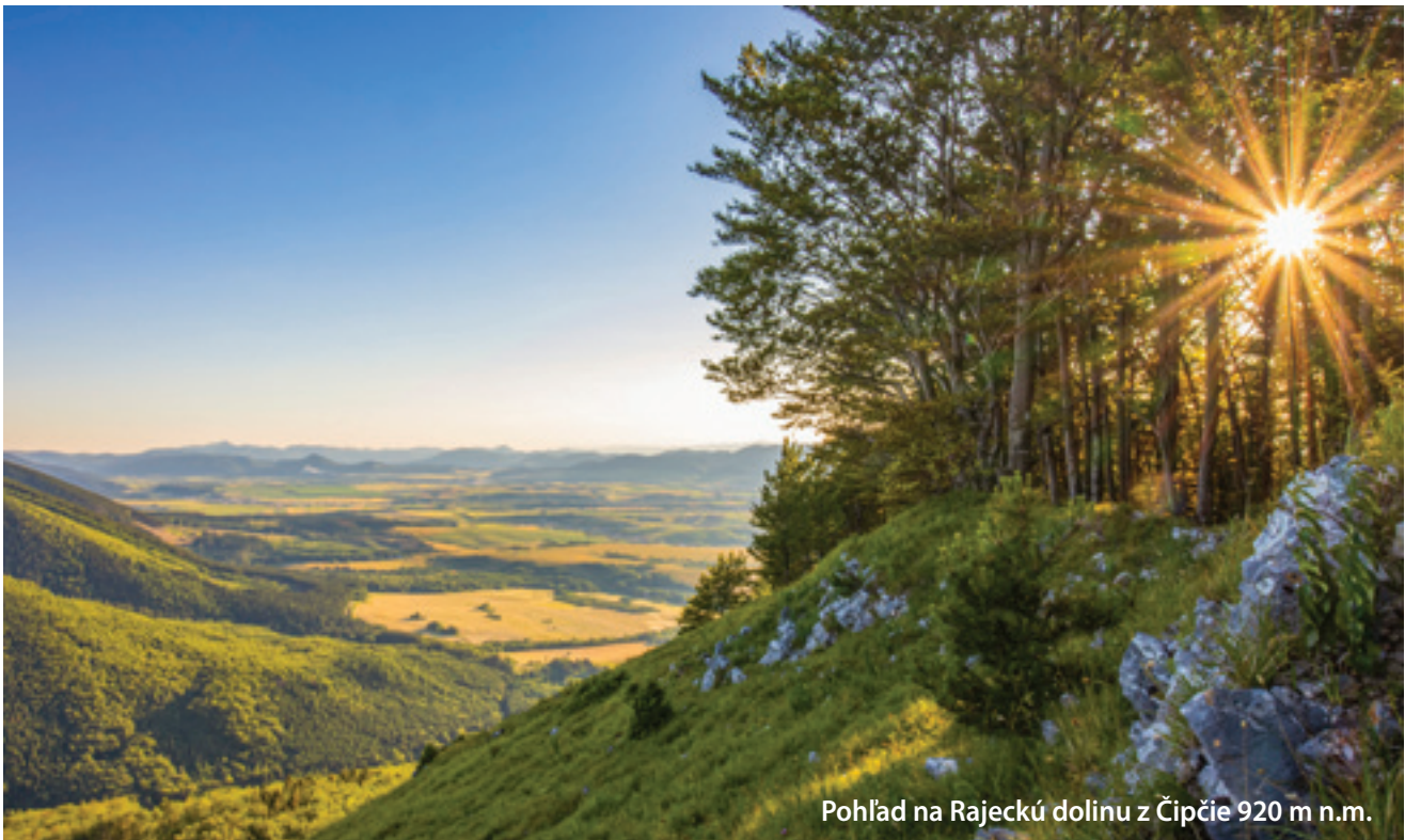
Pohľad na Rajeckú dolinu z Čipčie 920 m n.m.