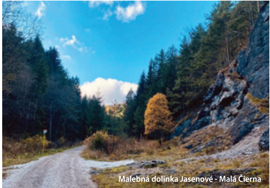
Malebná dolinka Jasenové - Malá Čierna

leží v nadmorskej výške 494 m n. m. Prvá písomná zmienka o nej pochádza z r. 1490. Počas II. svetovej vojny sa tu odohrali ťažké boje medzi Nemcami a povstalcami, o čom svedčí aj Pamätník SNP pod zámkom Kunerad, ktorý dal