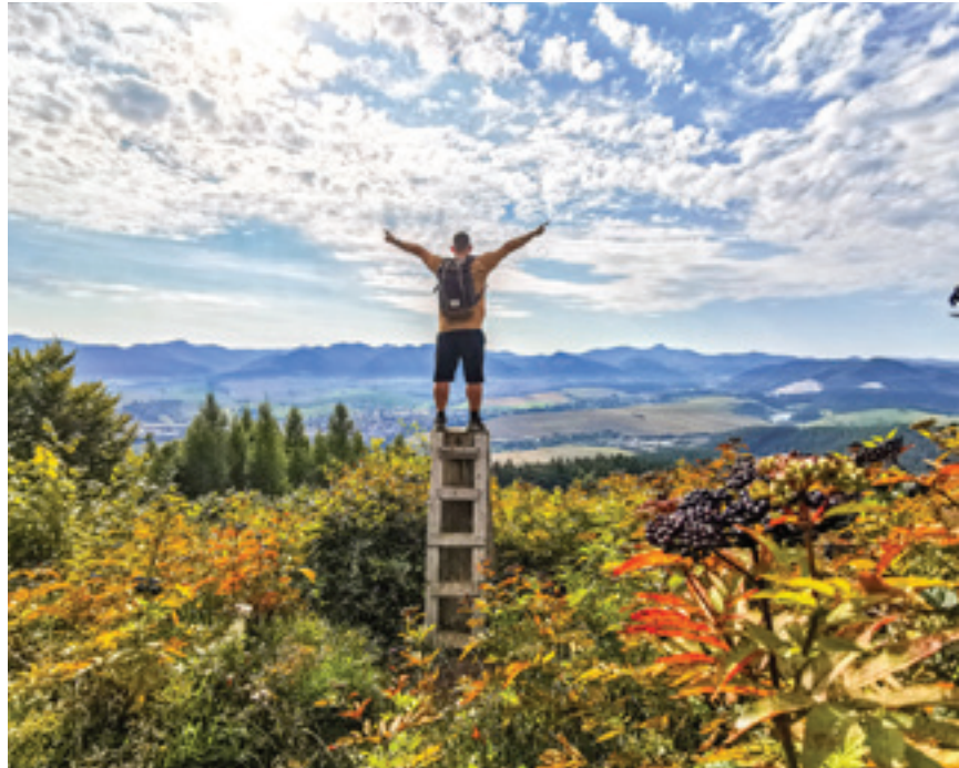
Malebný pohľad na Rajeckú dolinu z vrchu Dubová nad mestom Rajec

Aby si návštevníci, ale aj domáci milovníci turistiky, mohli toto prírodné dedičstvo Rajeckej doliny nerušené a bezpečne vychutnať a dobre sa v teréne orientovať, je starostlivosť o turistiku jednou z hlavných aktivít OOCR Rajecká dolina. Podieľame sa na budovaní značených turistických a náučných chodníkov a pravidelne každý rok vykonávame údržbu turistických chodníkov. Každý rok v spolupráci s Klubom Značkár zo Žiliny obnovujeme značenie vybraných turistických trás, zabezpečujeme výmenu turistických smerovníkov a tabuliek a realizujeme drobnú úpravu chodníkov ich spriechodňovaním v prípade veterných a snehových kalamít, ale aj prieruby a čistenie chodníkov od náletových drevín. Okrem údržby chodníkov sa venujeme aj obnove turistického značenia. V roku 2021 sme napr. obnovili miestne zna-