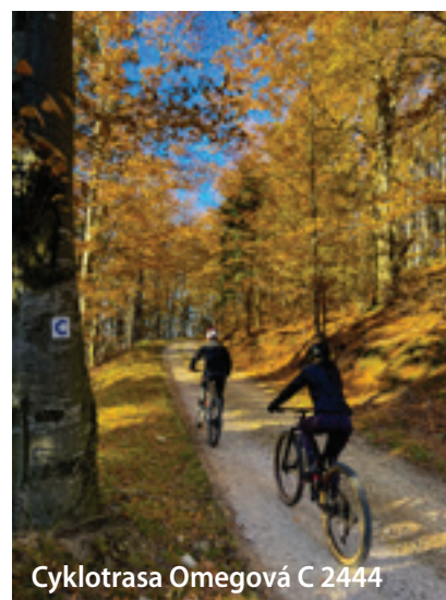
Cyklotrasa Omegová C 2444

sa stal MTBiker. Regióny sme prepojili cyklotrasami RD – Turiec, RD – Súľov, RD – Žilina s napojením na Vážsku cyklomagistrálu.