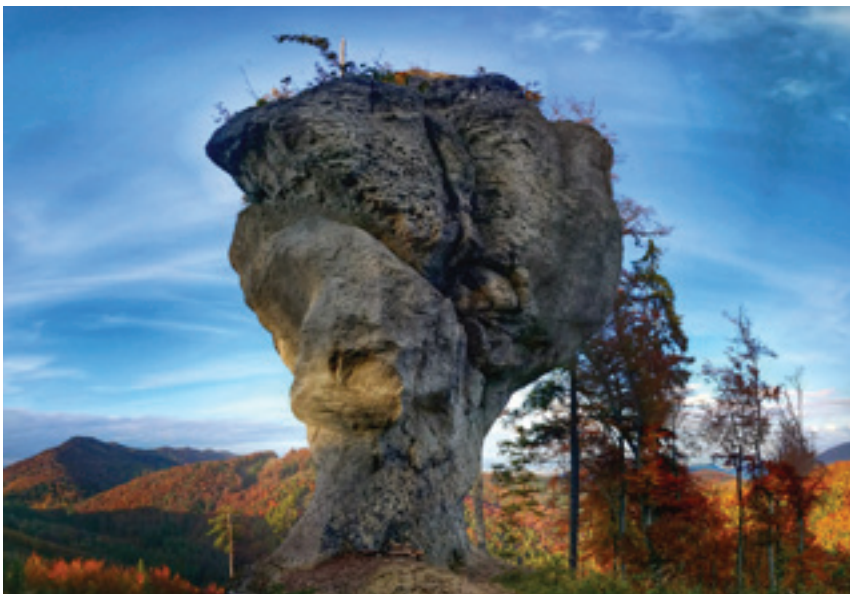
Stratený budzogáň pri obci Zbyňov

Heydrich opantovaný mocou si korunu nasadil a slová kľatby sa naplnili. 4. júna 1942 zomrel v dôsledku atentátu na otravu krvi.