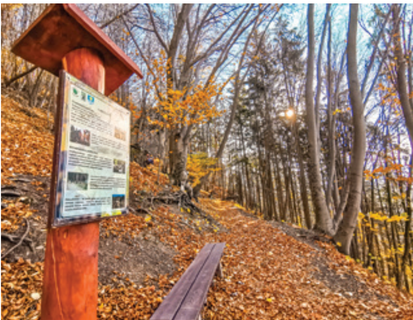
Náučný chodník „Dolná hora – pocta jarabine brekyňovej“