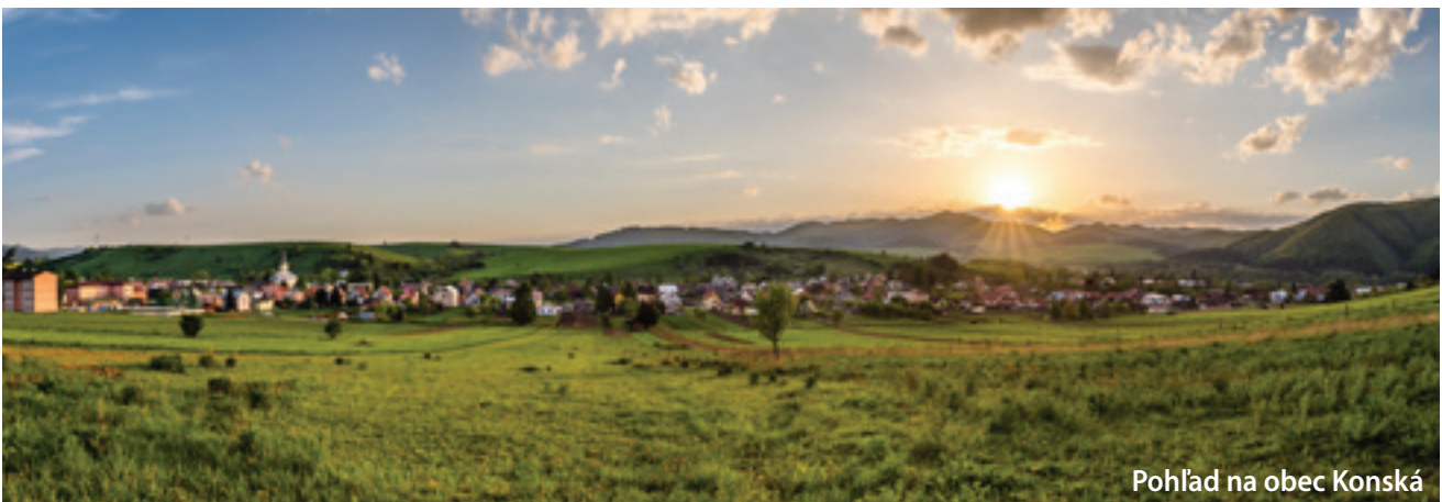
Pohľad na obec Kónská

sa ako osada Lietavského panstva po prvýkrát spomína v r. 1471 v darovacej listine kráľa Mateja Korvína ako Kys Charma. Nachádza sa tu Kaplnka Povýšenia sv. Kríža a postavená v r.