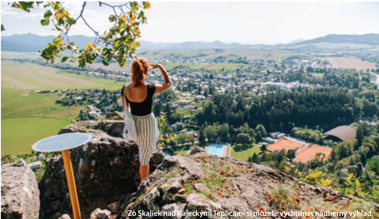
Zo Skaliek nad Rajeckými Teplicami si môžete vychutnať nádherný výhľad.