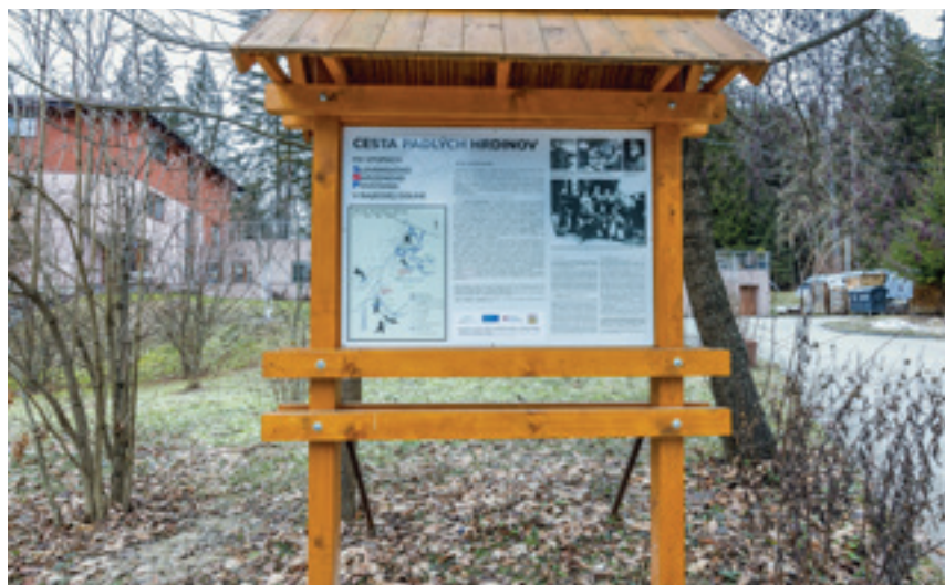
Cesta padlých hrdinov - po stopách SNP v Rajeckej doline