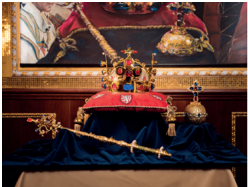
Replika českých korunovačných klenotov v Cabaret Aphrodite

Stratený budzogáň je jedinečný skalný útvar, ktorý má podobu zovretej päste a je vysoký približne 12 m. Z geologického aj geomorfologického hľadiska ho možno považovať za neuveriteľný a fenomenálny prírodný úkaz. Z vedeckého aspektu sa jedná o skalnú trosku vypreparovanú erozívnou činnosťou mrazu a vody. Dovedie vás k nemu náučný chodník. Tabule detailne popisujú prírodné prostredie okolia a tiež zaujímavú legendu. Tá hovorí, že v minulosti na mieste, kde dnes stojí Budzogáň, rástlo mohutné stromisko Hromodub.