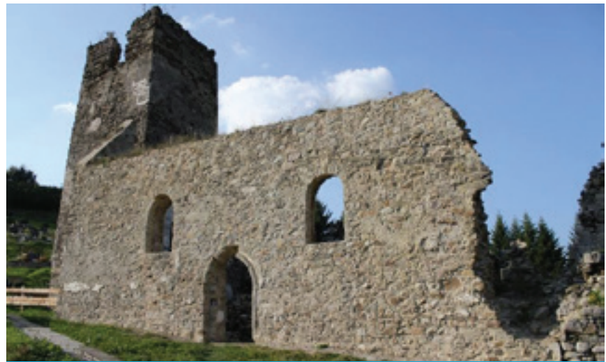
Zrúcanina gotického Kostola sv. Heleny Stránske

Ako sa tam dostanete? Náučný chodník sa začína pred Mestským múzeom v Rajci, označený je červenou značkou a dlhý 5,2 km. 307-metrové prevýšenie prekonáte približne za 4 hodiny.