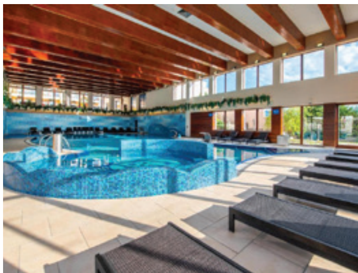
WELLNESS HOTEL DIPLOMAT****