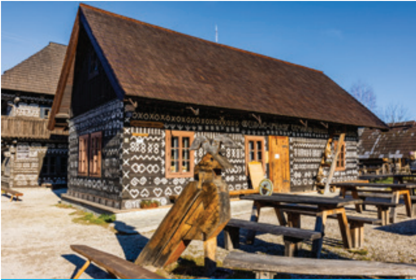
Čičmany - objekty ľudovej architektúry

expozičné, ktoré dokumentujú všedný i sviatočný život obyvateľov obce, ich rodinné zvyky a bývanie veľkoroďiny. To bolo pre Čičmany typické až do začiatku 20. storočia. Nenechajte si ujsť ani návštevu barokového Kostola Nájdenia sv. Kríža. Kostol bol postavený na základoch staršej stavby, pravdepodobne zvonice s modlitebňou, o čom svedčí správa o zvone z roku 1588. Z pôvodného zariadenia sa zachoval hlavný oltár z roku 1798. Čičmany v minulosti zaujali aj také osobnosti, akými boli Karol Plicka a Dušan Jurkovič. V súčasnosti sa vynímajú čičmanské ornamenty na oblečení našich olympionikov a zažívajú opäť svoju slávu. V septembri sa pravidelne koná v tejto rázovitej obci celoslovenské stretnutie fujaristov. Turisti môžu v tejto lokalite pokoriť vrch Strážov (1 213 m n. m.), lyžiari si zasa vyskúšať zjazdovku lyžiarskeho strediska Javorinka. Obdivovať možno aj citlivo zrekonštruovaný zemepanský kaštieľ z konca 18. storočia postavený v barokovo-klasicistickom štýle. Jeho posledným vlastníkom bol gróf Leopold Berchtold, minister zahraničia Rakúsko – Uhorska. V súčasnosti sa využíva ako penzión s reštauráciou.