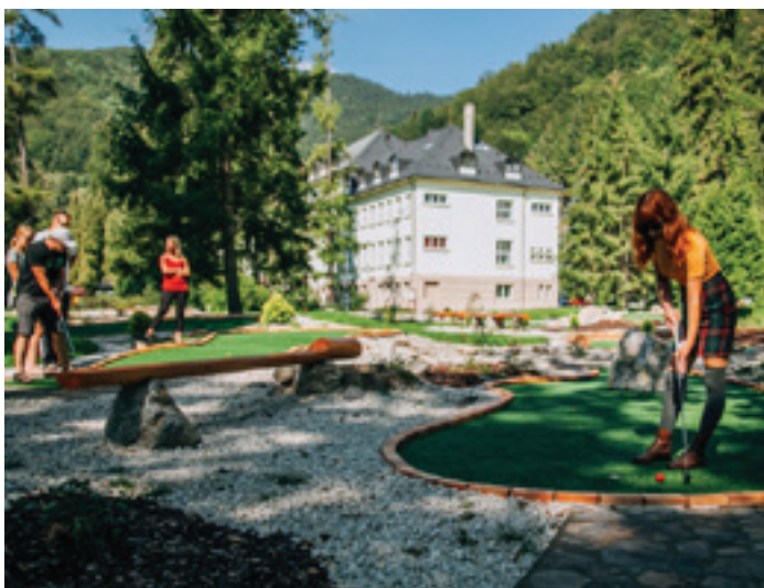
Activity park HOTEL SKALKA***

1936 – 1940. Najvýznamnejším podujatím v obci býva Memoriál Louisa Crosa pre peších turistov i cyklistov. www.malacierna.sk