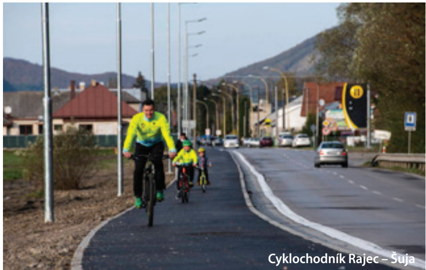
Cyklochodník Rajec – Šuja

RDn2K je nová značená cyklotrasa, vďaka ktorej majú cyklisti možnosť spoznať Rajeckú dolinu a jej atraktívne miesta o niečo viac. Určená je pre cyklistov i pre rodiny s deťmi. Hlavným zámerom projektu bolo vytvorenie relatívne nenáročného centrálného okruhu pre širokú verejnosť s dostupnosťou a s napojením na okolité cyklotrasy.