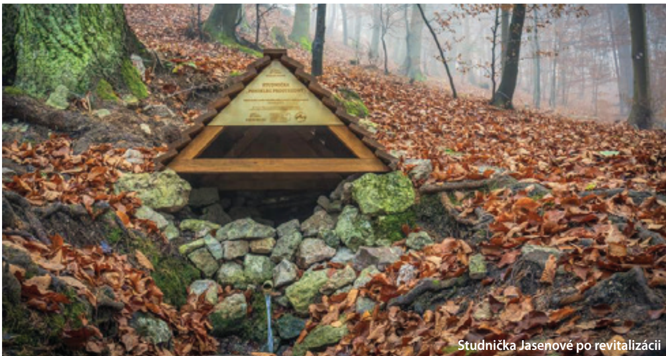
Studnička Jasenové po revitalizácii