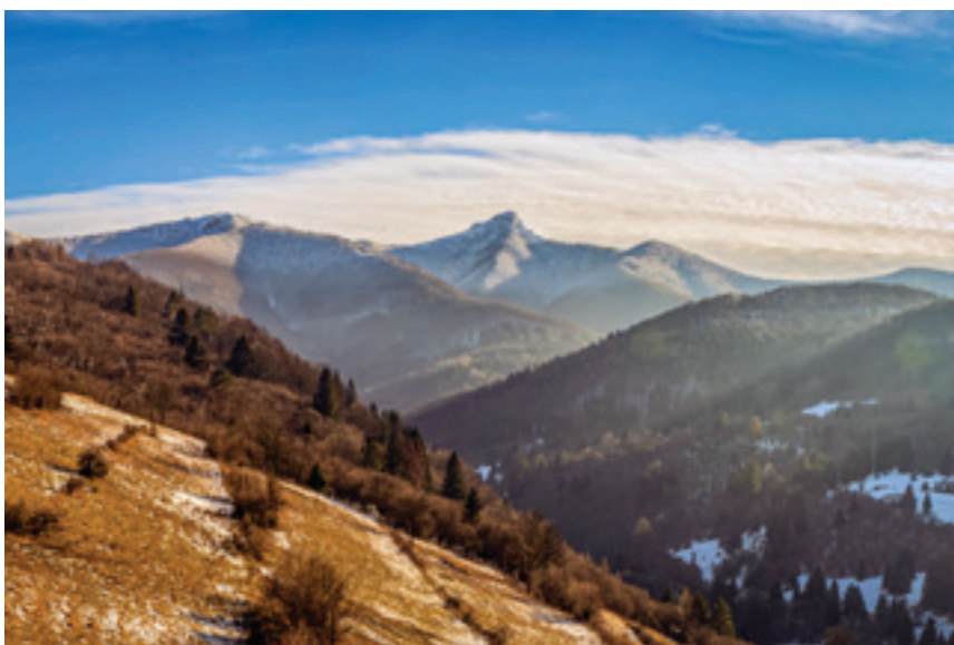
Vrch Kľak - majestátny strážca regiónu

Očarujúca príroda, krásne prírodné úkazy, dych berúce scenérie a výhľady, bohatá história, kultúrne pamiatky, termálne liečivé pramene, to je Rajecká dolina – „ malý kus zeme s veľkým srdcom “. Z množstva atraktívnych miest sme vybrali pár tých najzaujímavejších, ktoré by mal vidieť v Rajeckej doline každý návštevník alebo obyvateľ.