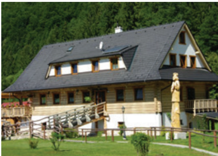
PENZIÓN* A REŠTAURÁCIA MLYNÁRKA