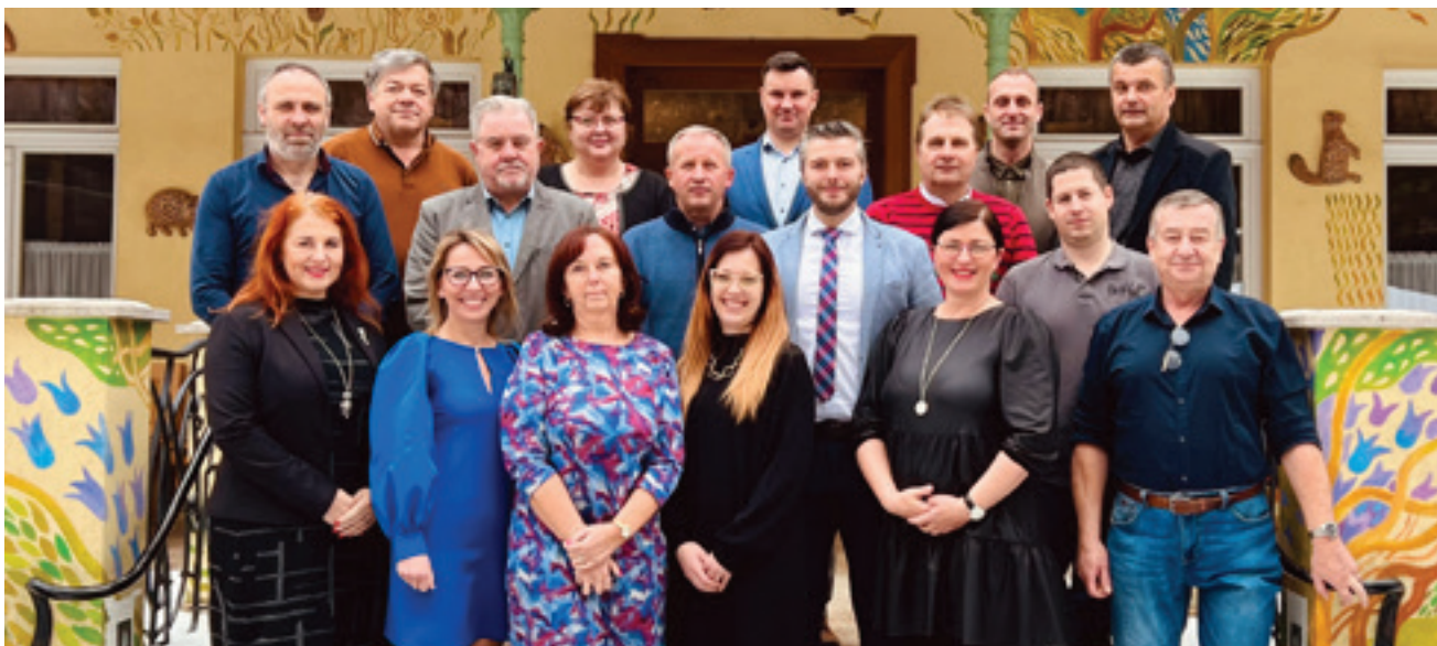
Členovia OOCR Rajecká dolina zúčastnení na valnom zhromaždení dňa 27. 1. 2022